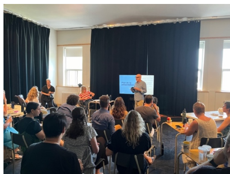
Présentation du processus décisionnel du mode de conception-construction, le 18 septembre 2024, 37 personnes de 15 organismes