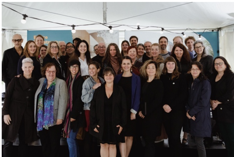
Membres et collaborateurs du ROCAL lors de la pelletée de terre de l'Infrastructure culturelle le 23 septembre 2024