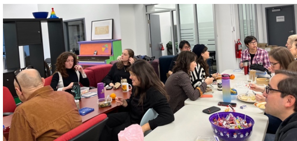
« Mercredi ROCAL » au pavillon Laurier, le 27 novembre 2024, 22 personnes de 8 organismes

Des « Mercredi ROCAL » ont été mis en place afin de créer des opportunités de rassembler sur la période du dîner les équipes des organismes pour apprendre à se connaître davantage et discuter informellement des nouveautés, des projets actuels et futurs, de réalités et enjeux vécus, de solutions à des problèmes, de politique, etc. Aussi, la période des fêtes a permis de relancer la traditionnelle Fête de Noël du ROCAL qui a rassemblé 43 personnes provenant de 14 organismes.