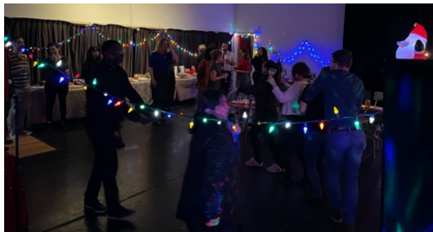
Party de Noël, le 12 décembre 2024, 43 personnes de 14 organismes