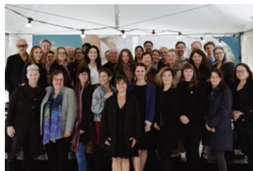
Pelletée de terre officielle et dévoilement du concept architectural de l'Infrastructure culturelle, le 23 septembre 2024, avec 32 personnes de 13 organismes.